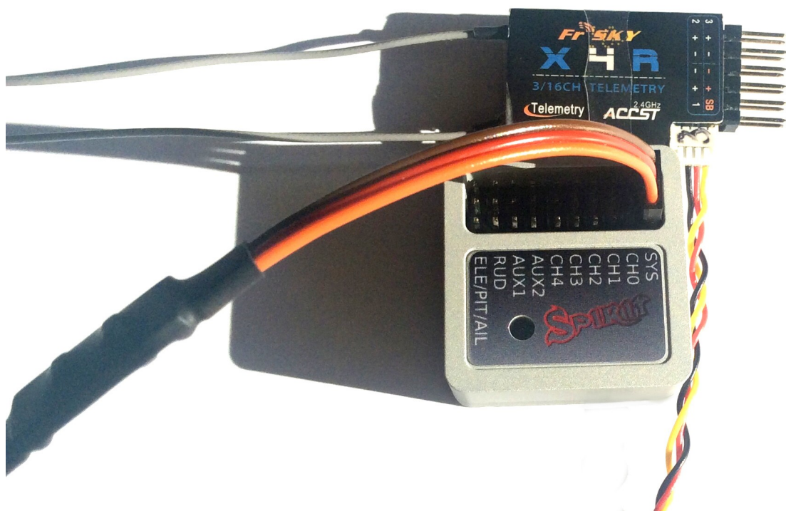
Ukázka 1: schéma zapojení části integrace s přijímačem X4R-SB